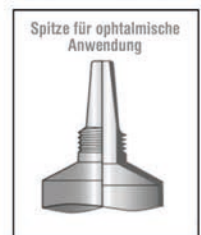
Spitze für ophthalmische Anwendung